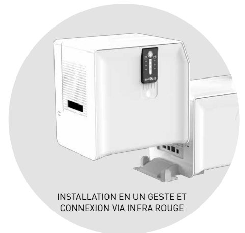
INSTALLATION EN UN GESTE ET CONNEXION VIA INFRA ROUGE